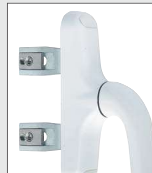
CR116 incorpora el Kit en las palas includes outward kit in shovels incorpora o kit en pàs