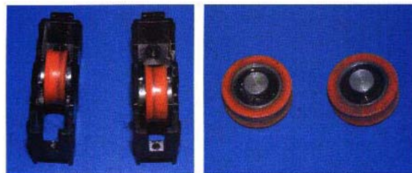
Rodamientos después de 25.000 ciclos con 30 kg/rodamiento

Resultado-Retrieved Result: Satisfactorio-satisfactory