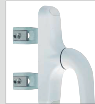
CR116 incorpora el Kit en las palas includes outward kit in shovels incorpora o kit en pás