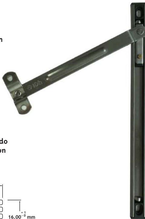
LA103-10-201 Compás limitador de fricción