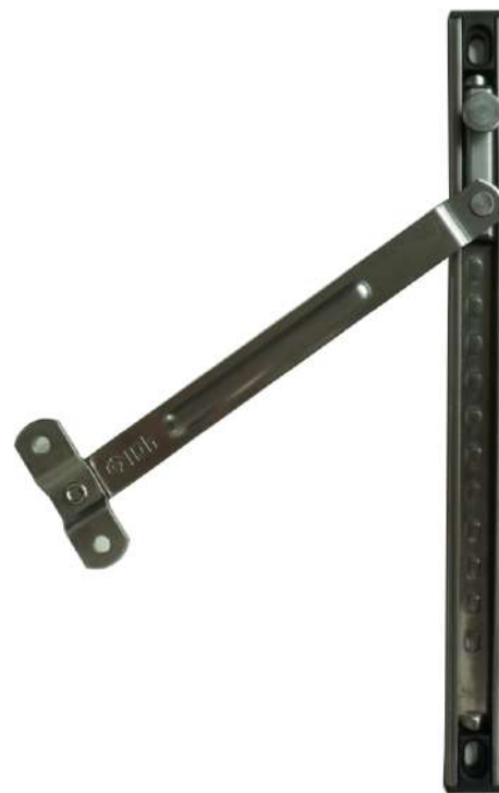
LA103T-10-201 Compás limitador con tornillo de fijación